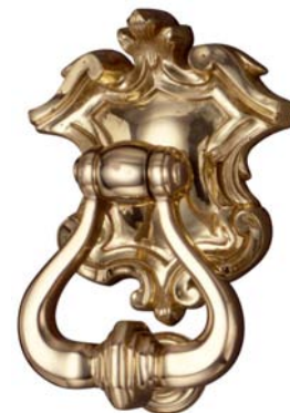
Fotos: Renaissance Türklopper